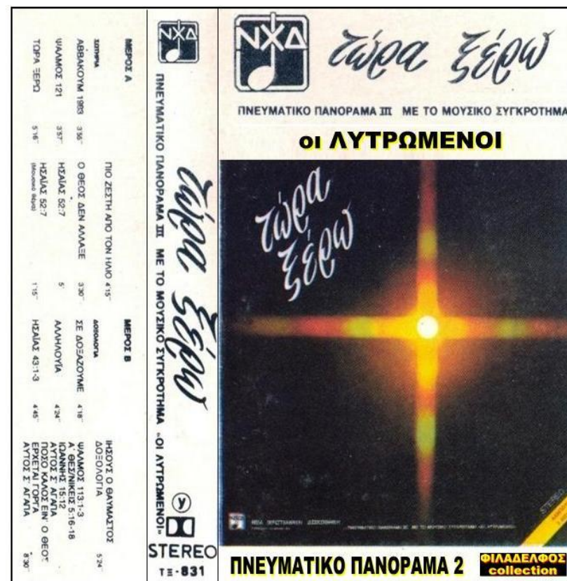
Το "ΠΝΕΥΜΑΤΙΚΟ ΠΑΝΟΡΑΜΑ 3" κυκλοφόρησε και σε διπλό δίσκο LP (33 στροφών)

Χαίρετε πάντοτε με τον Κύριο. Χαίρετε, χαίρετε, πάλι θα σας πω! Χαίρετε πάντοτε με τον Κύριο. Χαίρετε, χαίρετε, πάλι θα σας πω!