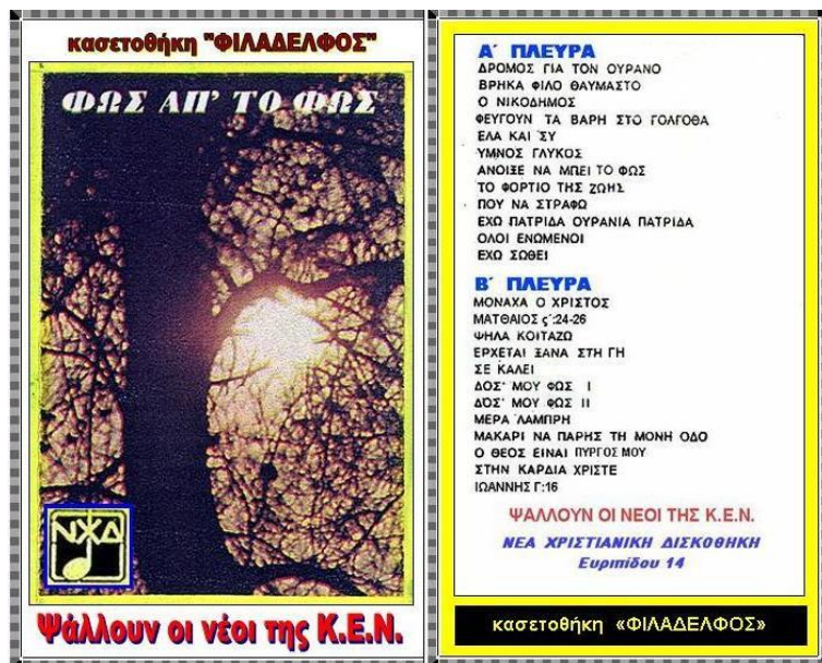
"ΦΩΣ ΑΠ' ΤΟ ΦΩΣ" - "ΠΝΕΥΜΑΤΙΚΟ ΠΑΝΟΡΑΜΑ 1"